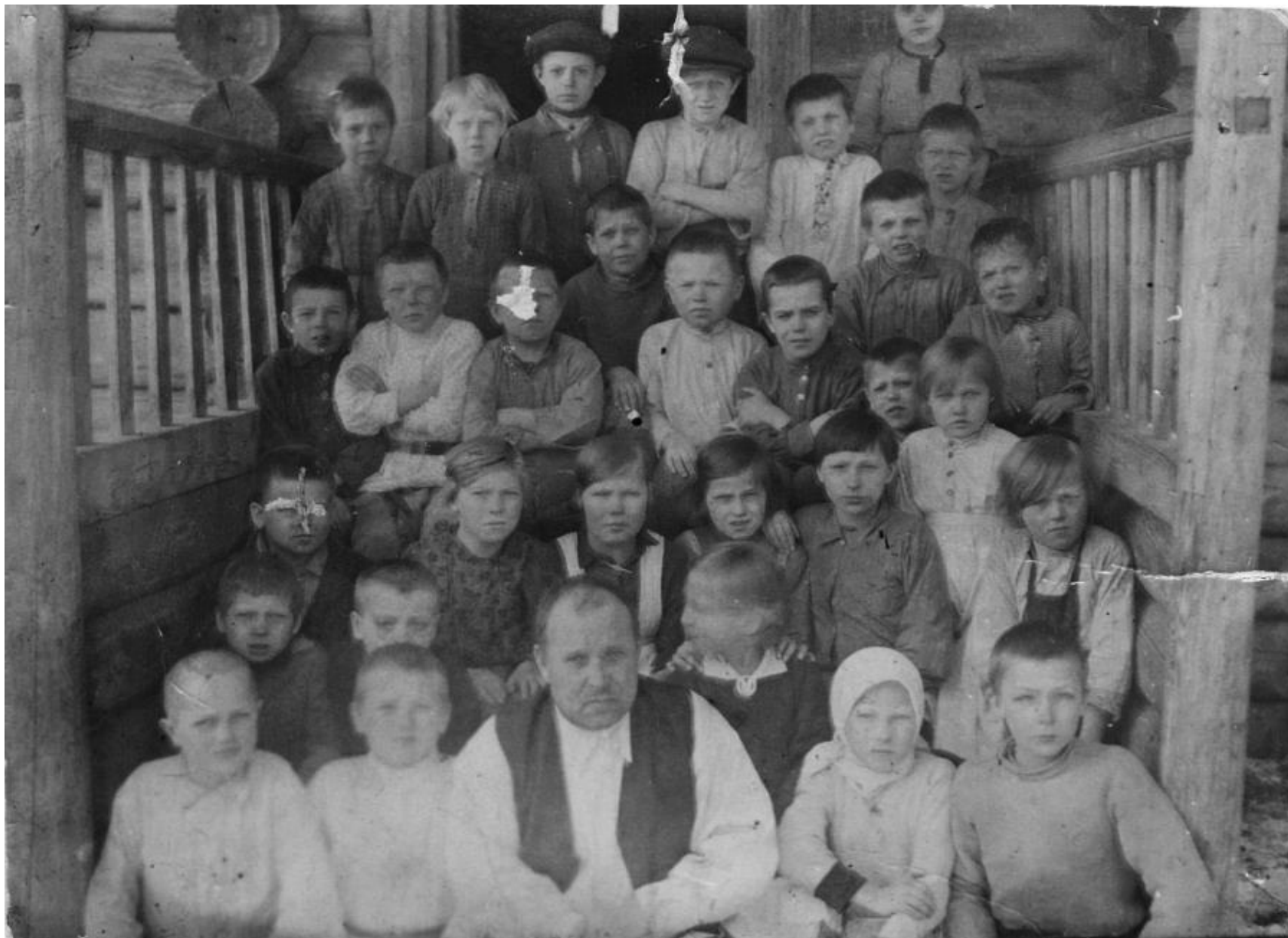
1939. учащиеся Черновской начальной школы. 4552