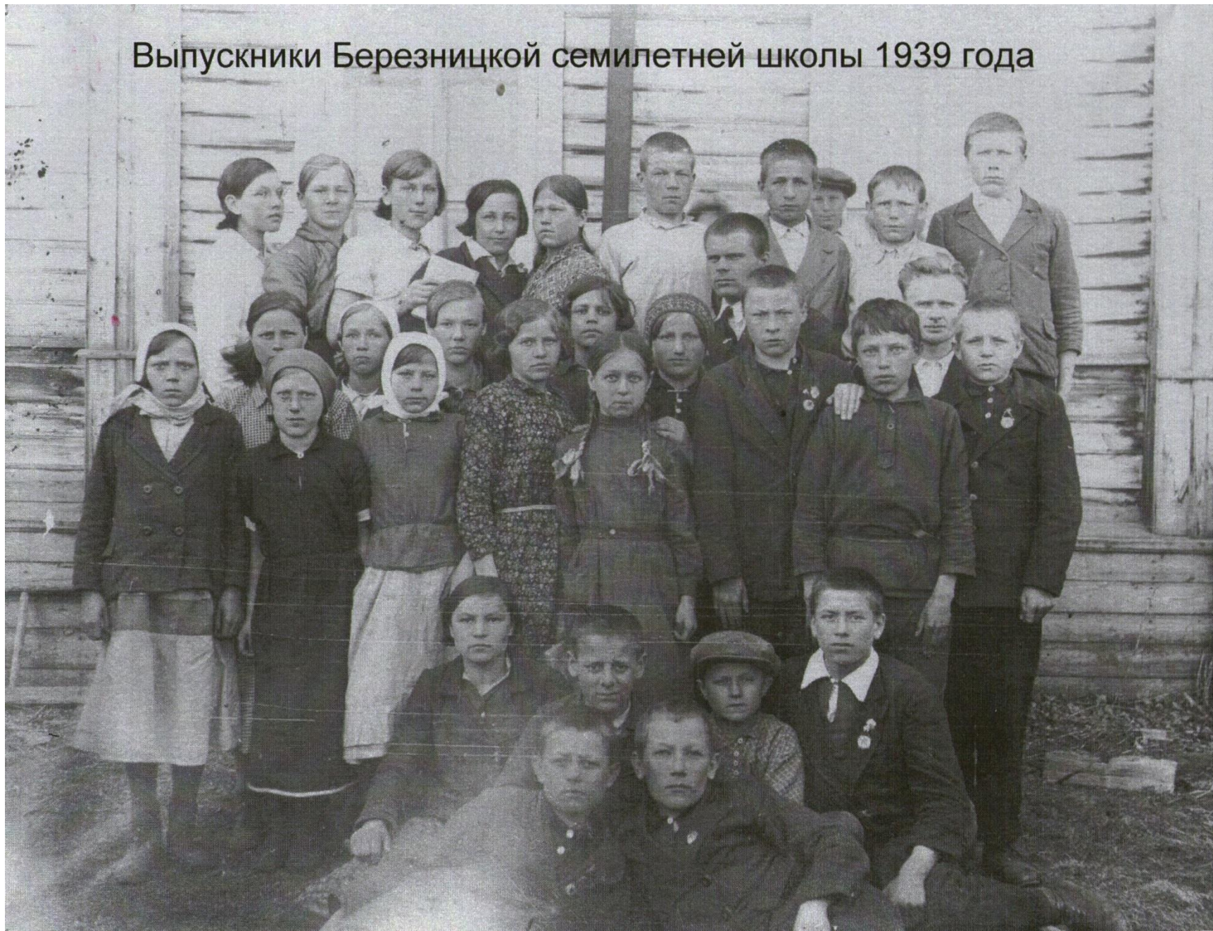
Выпуск 1939 г. Березницкой школы