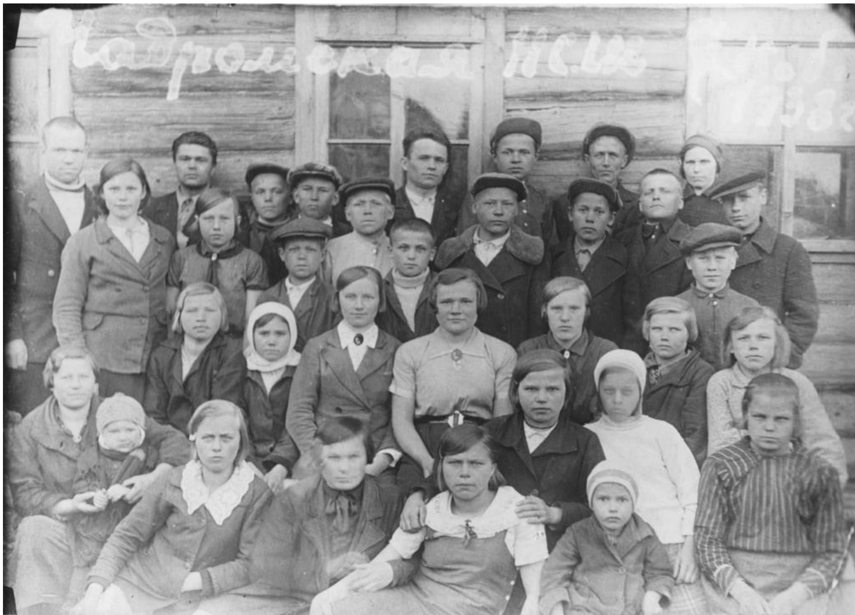
1938. Учителя и учащиеся Чадромской неполной средней школы.