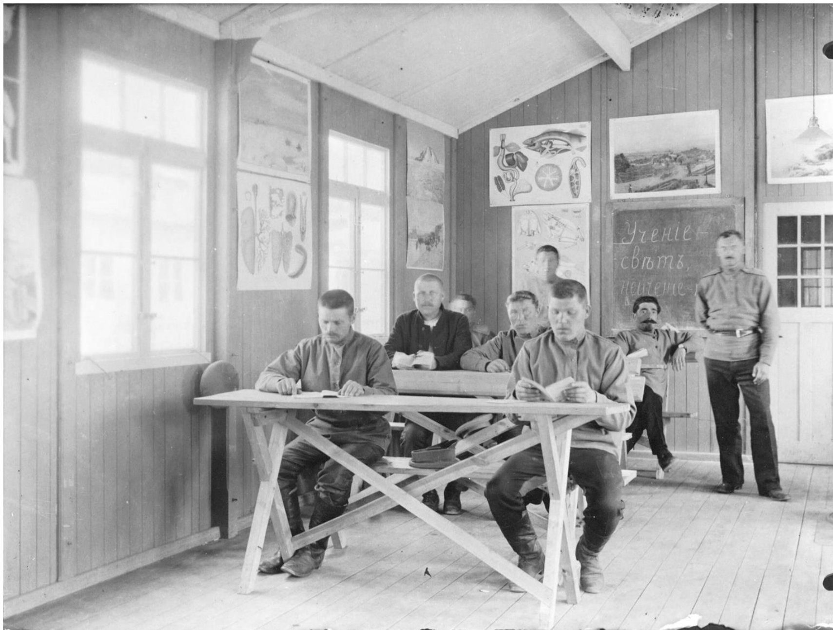
Обучение русских военнопленных в школе в лагере Хорсеред