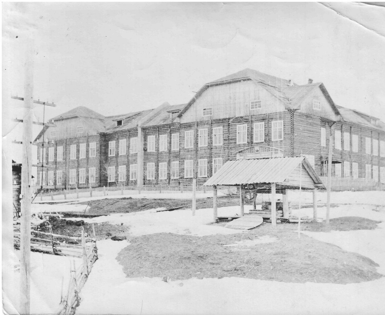
Здание УСШ, построено в 1938, начало работы в 1939 г. 2