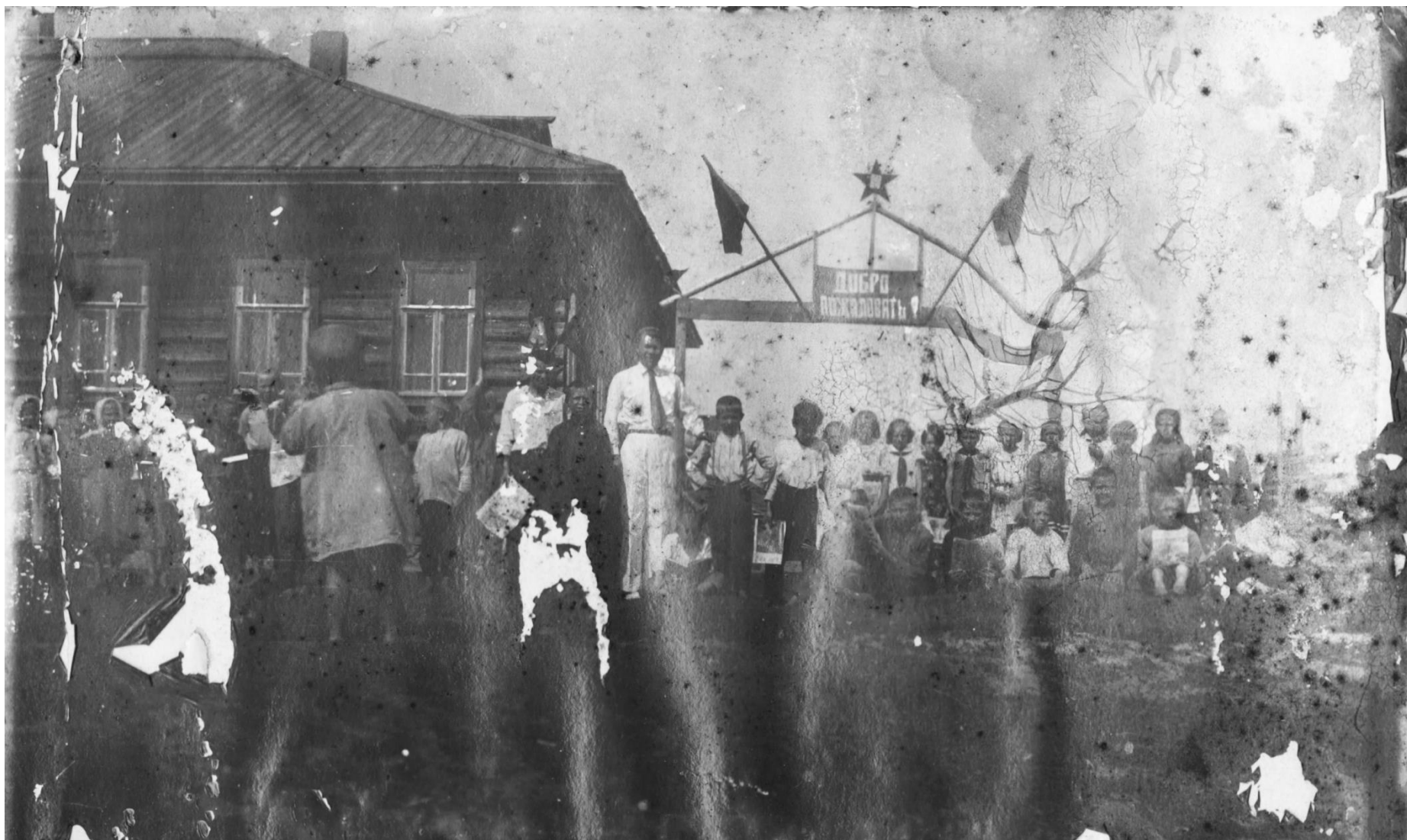
Пионеры одной из школ Черевковского района