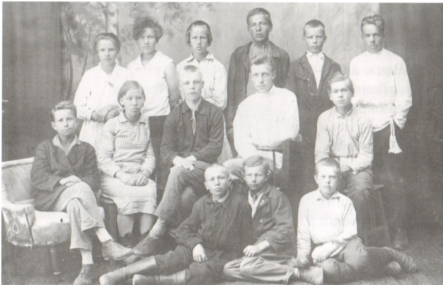
Участники коллектива Синяя блуза УСШ