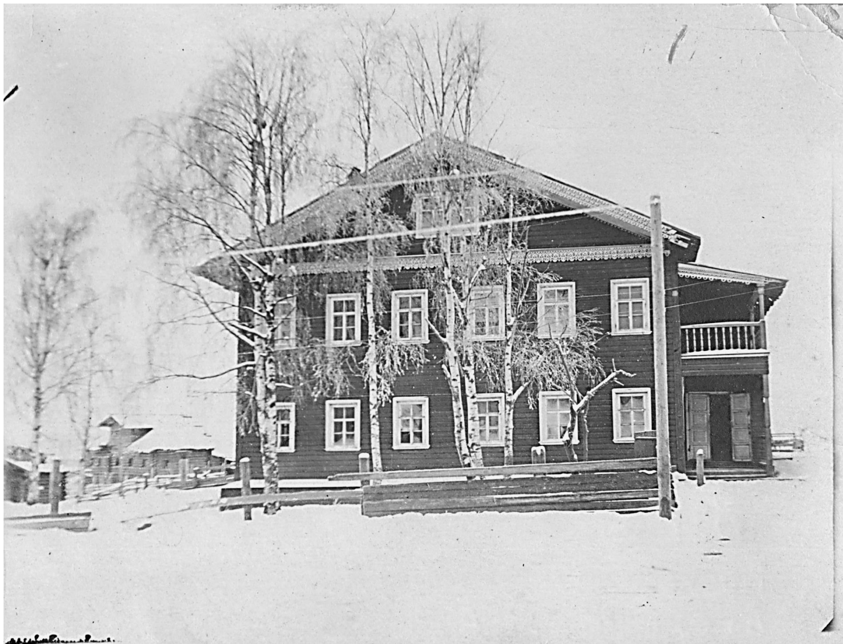
Здание, в котором размещались нач. школа, ГПТУ-34 в с. Шангалы