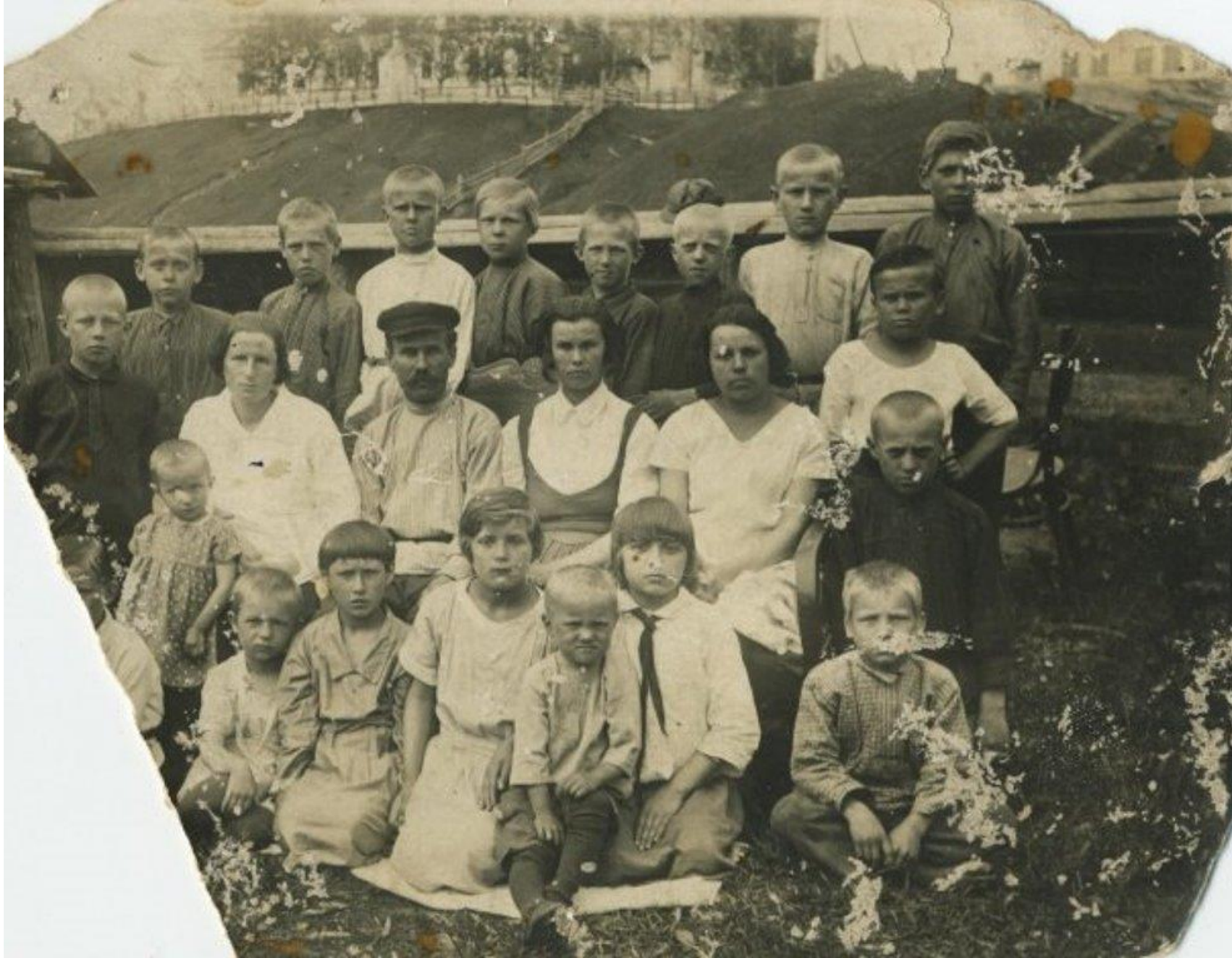
1929 год. Снимок сделан у Бестужевской нижней школы во время выпускного