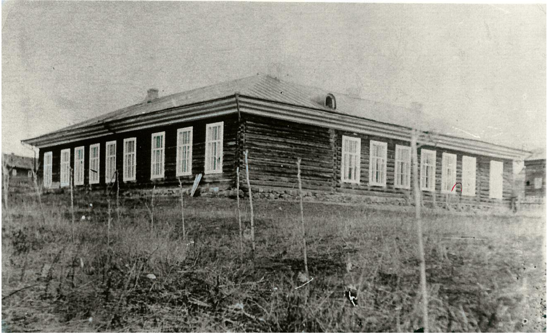
Здание зеленой школы