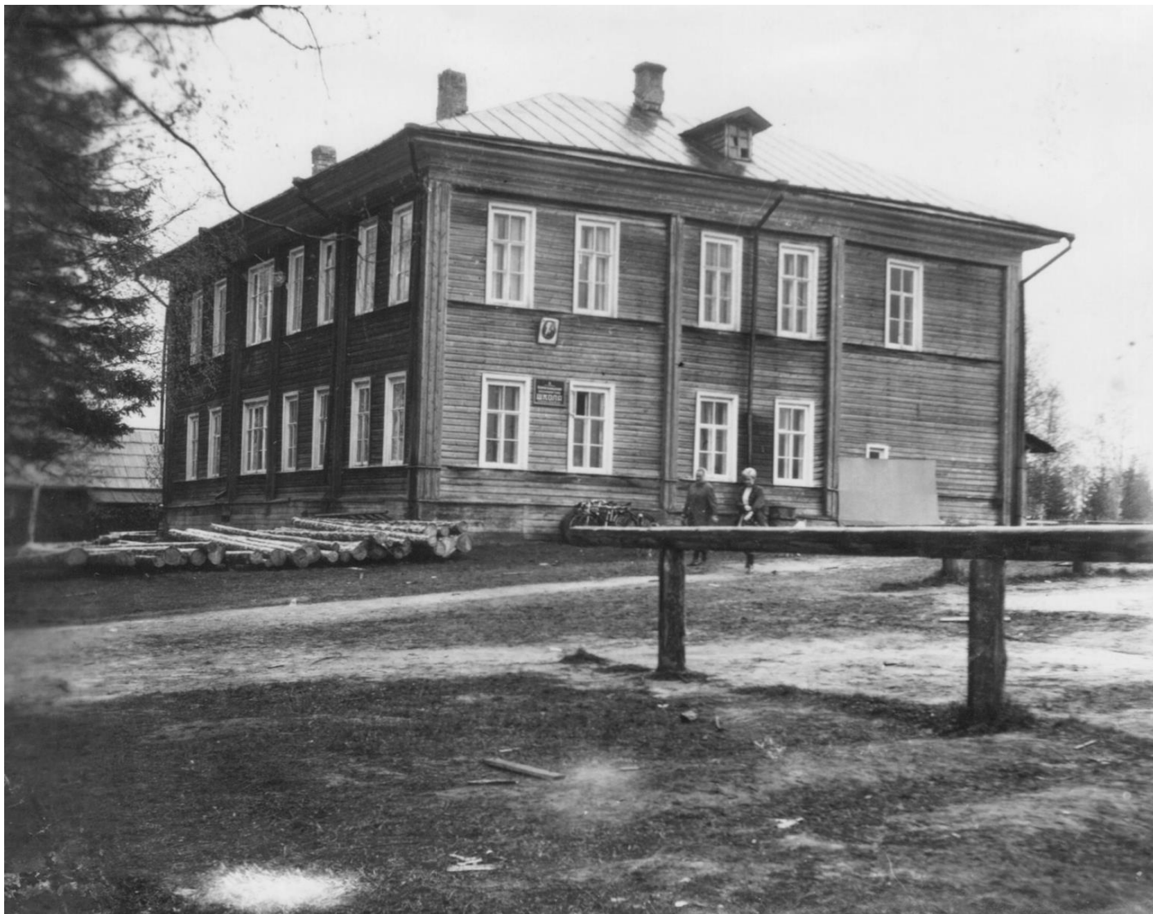
1916 год. Здание Березницкого земского училища