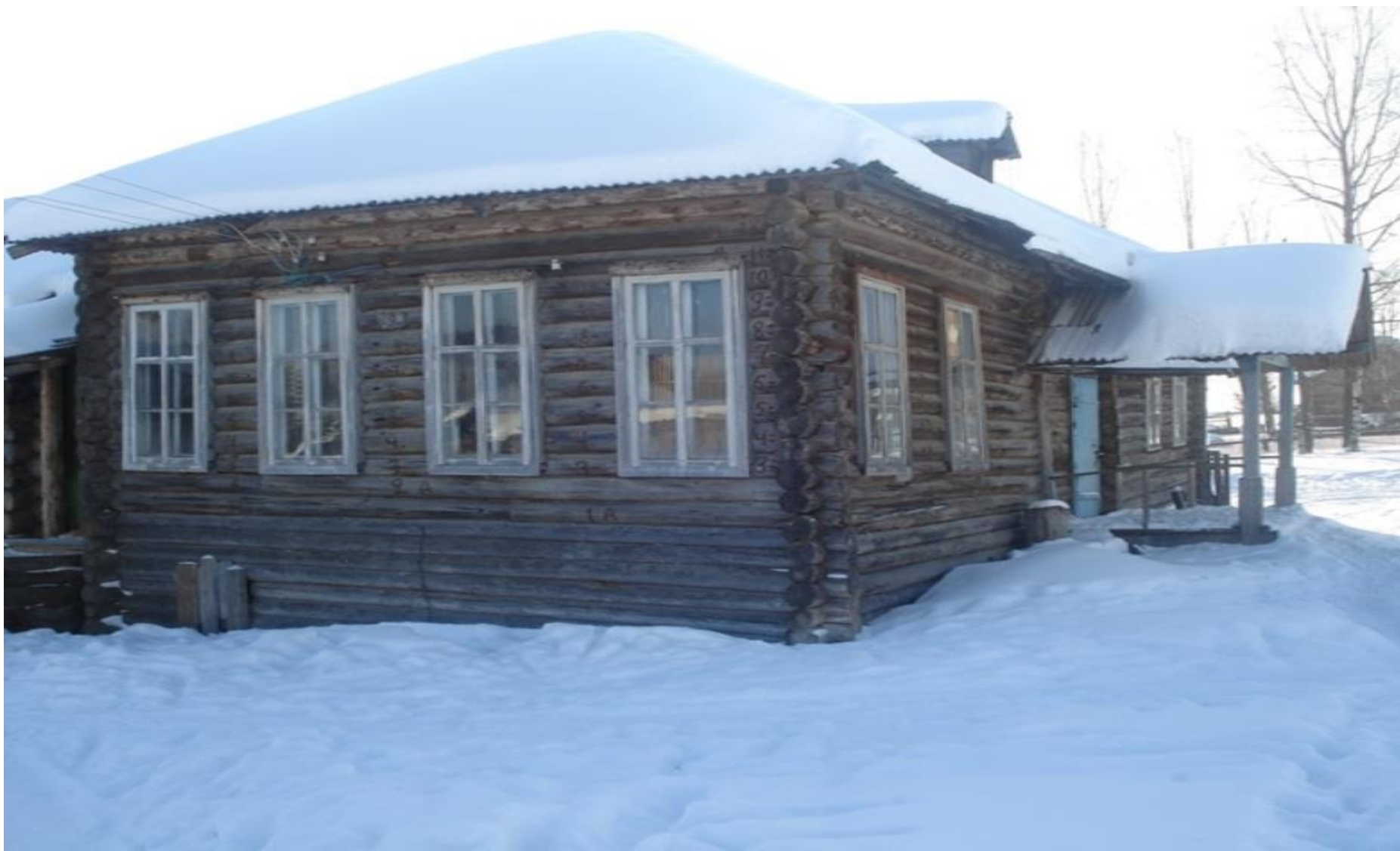
Мастерские БСШ, здание бывшего земского училища