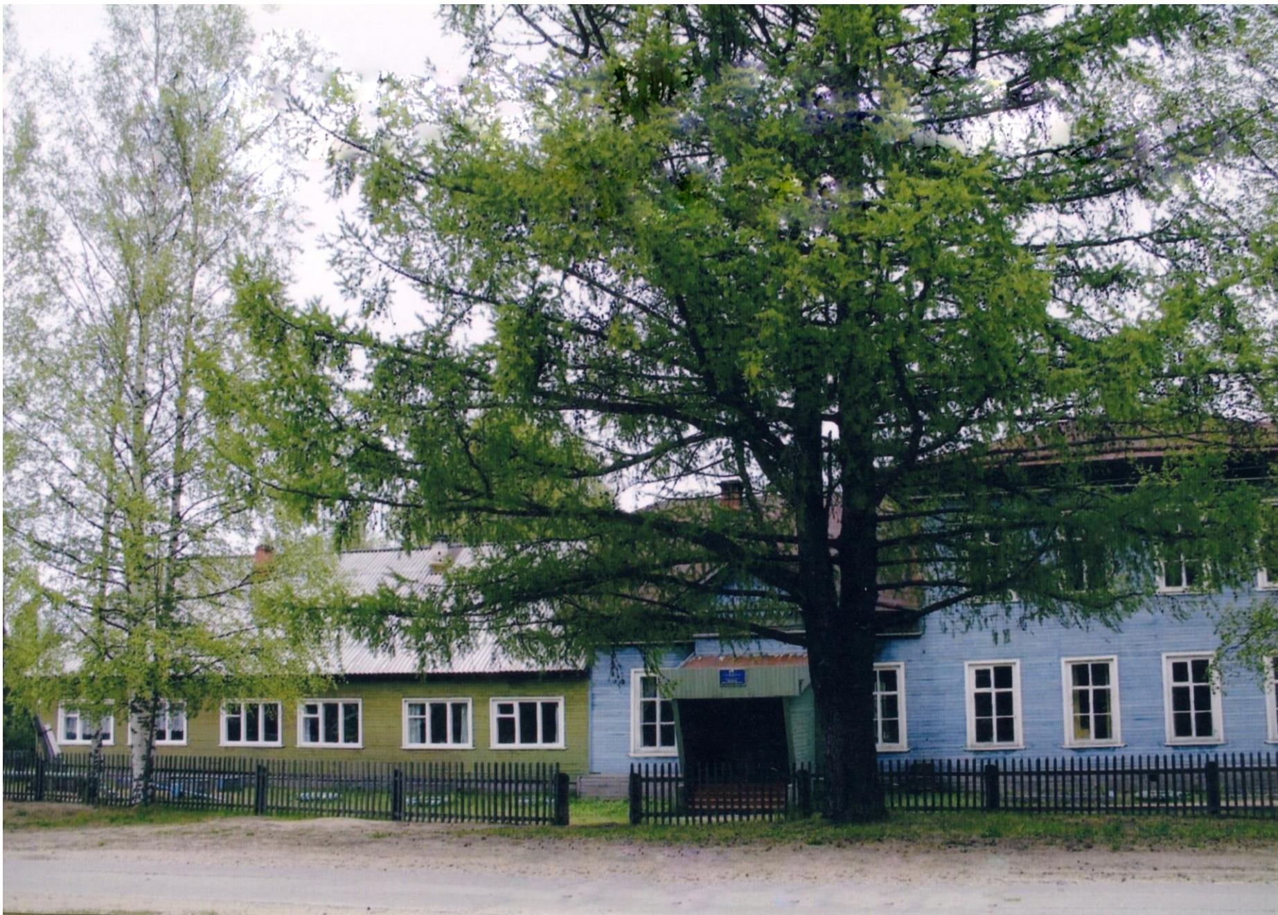
Справа здание бывшего Минского земского училища