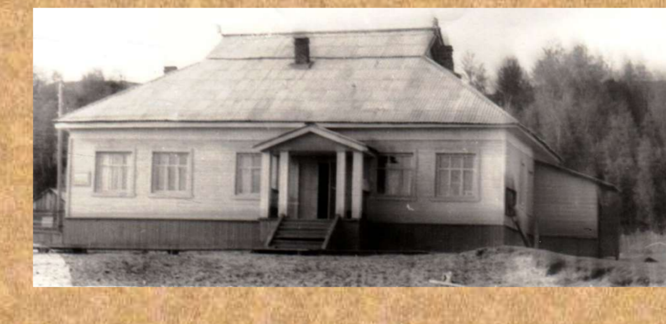
Здание, где размещался пришкольный интернат с 1969 по 2018 год. Фотография начала 70-х годов XX века.