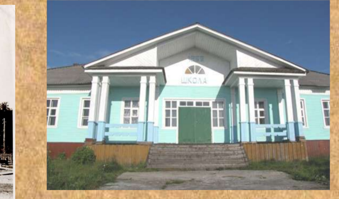
Школа в начале 2000-х годов.