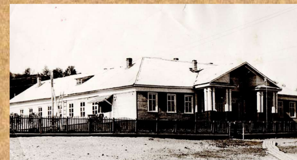
Школа в 70-е годы XX века.