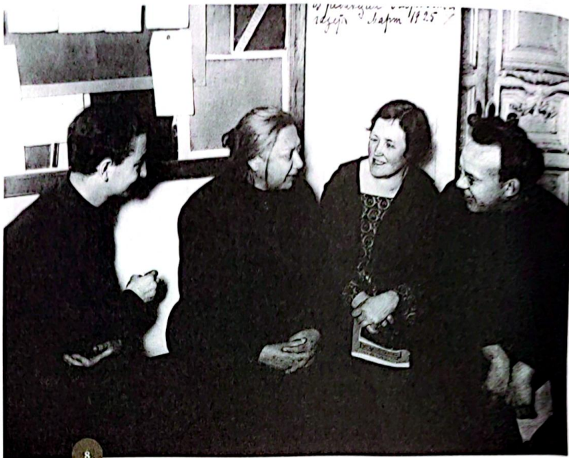
Ф. 108 оп. 1. Д. 52. Подлинник

Учитель Троцкий из Башкирской республики: «Вчера в Большом театре я поглядел вокруг и подумал: а ведь 10 лет тому назад учительство собиралось на съезд при царизме, и поганый Пуришкевич сказал, что это