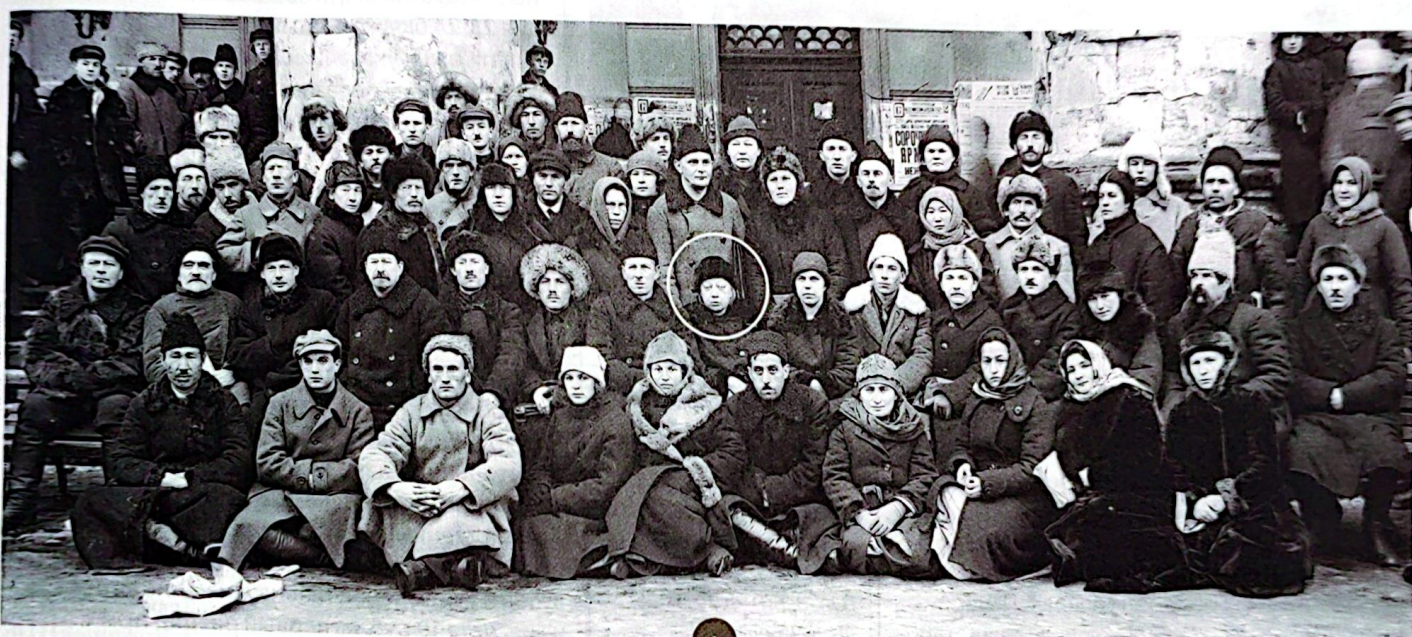
ФОТО: Г. ПЕТРОВА, РГАСПИ. Ф. 394, оп. 2, л. 51, подлинник

Съезд открылся 12 января 1925 г. в здании Большого театра. В нем приняли участие 1660 человек со всех уголков Советского Союза, большинство из них — сельские учителя. В фондах РГАСПИ хранятся любопытные неопубликованные материалы об острых дискуссиях, которые велись на съезде, работавшем шесть дней вплоть до 17 января.